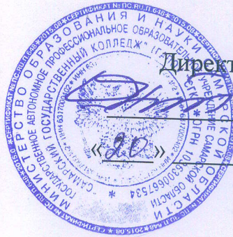
ГРАФИК проведения плановых заседаний психолого-педагогического консилиума ГАПОУ «СГК» на 2020 год