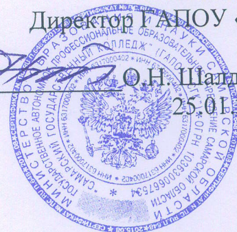
ГРАФИК проведения плановых заседаний психолого-педагогического консилиума ГАПОУ «СГК» на 2021 год