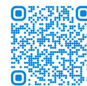
Чат приемной комиссии