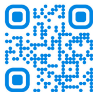
График работы приемной комиссии Понедельник с 8:00 до 16:00 Вторник с 8:00 до 16:00 Среда с 8:00 до 16:00 Четверг с 10:00 до 19:00 Пятница с 8:00 до 15:00 Суббота, воскресенье - выходной

Вступительные испытания проводятся с 29 июля по 10 августа 2026 года .