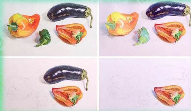
Пример многослойной акварельной живописи

Основное отличие техники «А-ля-прима» от других техник живописи заключается в том, что картина должна быть готова до полного высыхания красок.