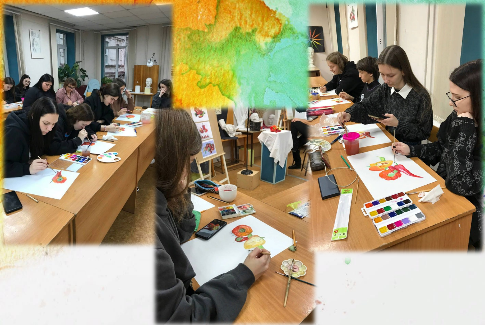
Ход работы над этюдом натурной постановки с технике «А ля прима»